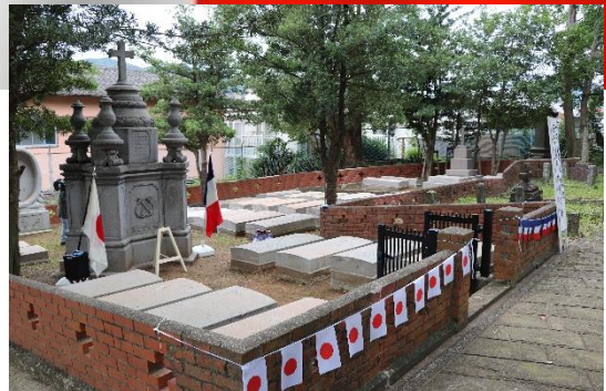
2021年フランス海軍墓地

浦上村山里の地に開設された坂本国際墓地には、1900年の義和団事件で傷病を負い、長崎で看護されながらも亡くなったフランス海軍水兵をはじめとする、多くのフランス人が眠っています。